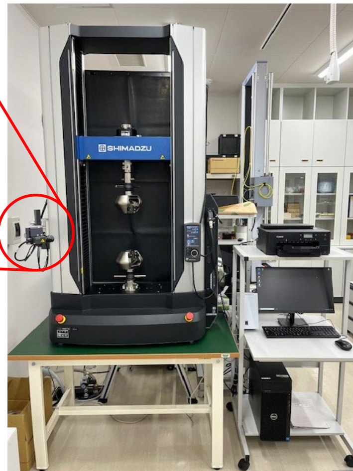
設備外観 (引張試験用治具装着時)