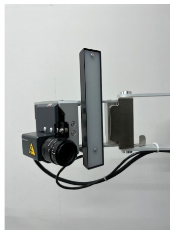
非接触ビデオ伸び計