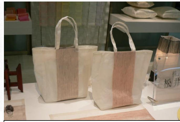
絹ラミネート素材で作製したバッグ