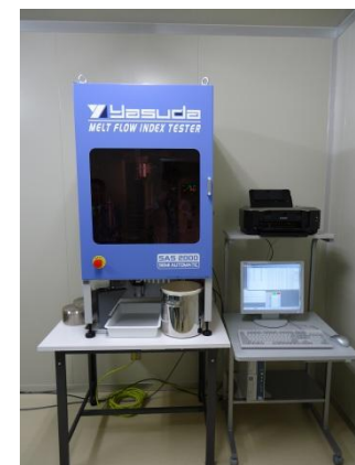
メルトインデクサー