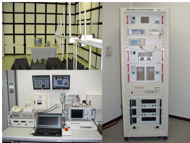
イミュニティ試験システム