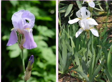
Iris pallida Iris florentina (シボリイリス) (ニオイアヤメ)