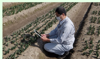
モバイル機器を使った判定動作確認の様子